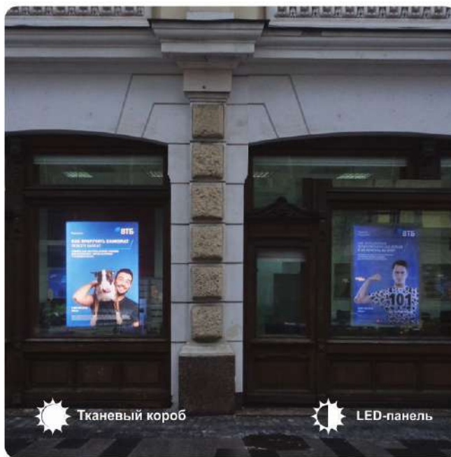
☀️ Тканевый короб